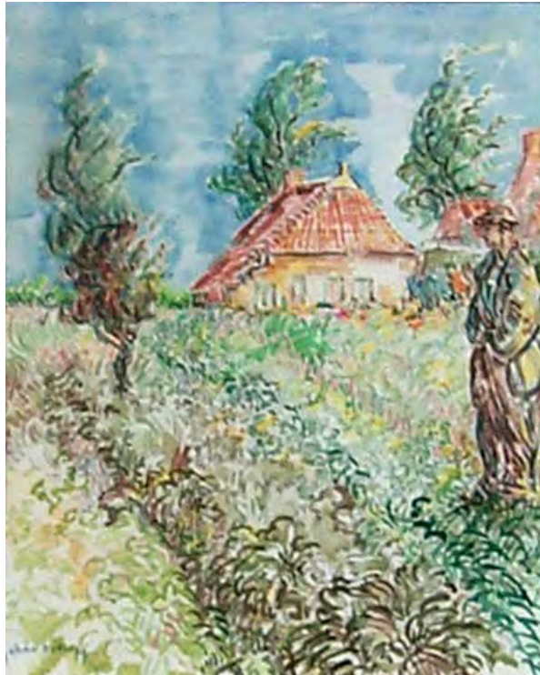
Aquarel 'Blauw Börgje,' Gesigneerd linksonder: 'Johan DYKSTRA' 34.2 x 28.1 cm

Zeven argumenten waarom het schilderij 'Blauw Börgje' een vervalsing is: